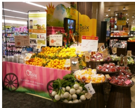
Oisix の専用コーナー (中目黒本店)