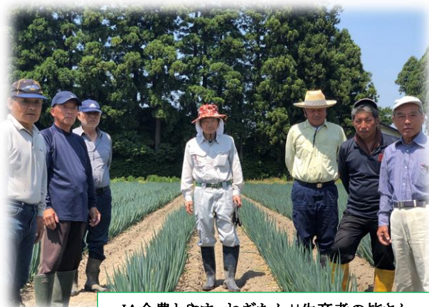
JA全農とやま ねぎたん♪生産者の皆さん