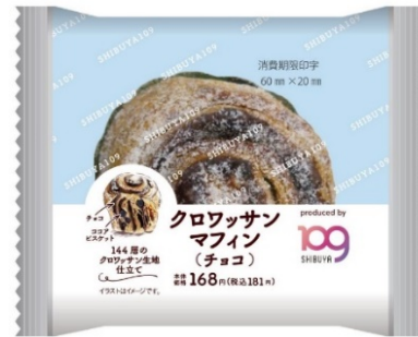
商品パッケージイメージ