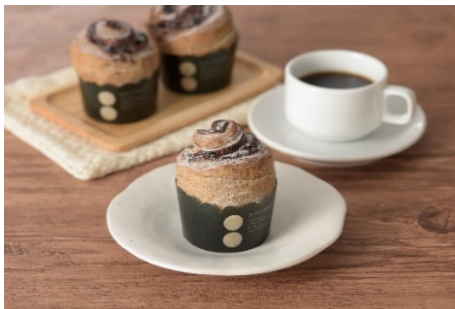
「SHIBUYA109 監修クロワッサンマフィン(チョコ)」(税込 181 円)

株式会社ローソン(本社:東京都品川区、代表取締役社長 竹増 貞信)、株式会社東急ストア(本社:東京都目黒区、代表取締役社長 大堀 左千夫)、株式会社 SHIBUYA109 エンタテイメント(本社:東京都渋谷区、代表取締役社長 石川 あゆみ)は、3社で共同開発した「SHIBUYA109 監修クロワッサンマフィン(チョコ)」(税込 181 円)を、7月11日(火)から、関東甲信越のローソン店舗および東急ストアで発売します。お客様に「わくわくするような楽しいお買い物体験をしていただきたい」という共通の想いのもと3社で初めて共同開発した商品です。