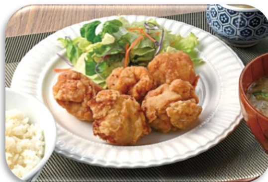
醤油の旨み際立つ！薄衣の若鶏もも唐揚

第17回からあげグランプリ® 「東日本スーパー総菜部門」で 金賞を受賞。 バランスよくブレンドした3種 の醤油に、超特選醤油でコクと 旨みを引き出しました。薄衣で ジューシーな唐揚です。