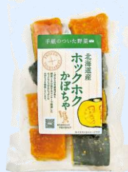
ホックホクかぼちゃ