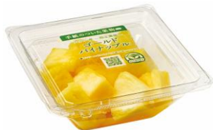
「手紙のついた果物」 ゴールドパイナップル