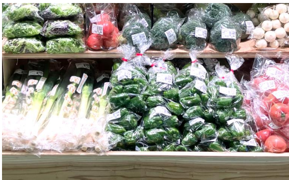
地場野菜や川崎市ゆかりの商品をラインアップ