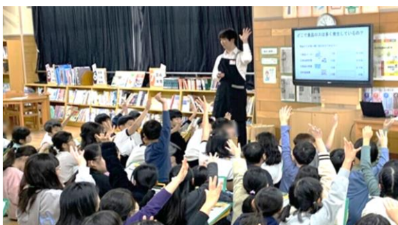
食育教育、環境活動などの学びや交流の場となる企画を実施