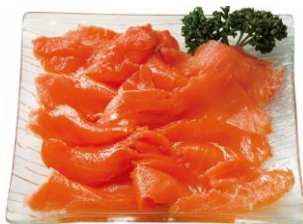
「王子サーモン」 スモークサーモントラウト切り落とし

『手紙のついた野菜と果物』が冷凍食品として登場！生産者こだわりの商品がいつでも気軽にお楽しみいただけます。