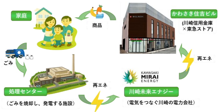
市処理センターのバイオマス由来の電気等、実質再エネを100%活用したビル運営