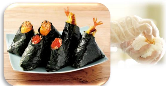
手作りおにぎり各種