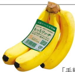
「手紙のついた果物」 もっちりバナナ