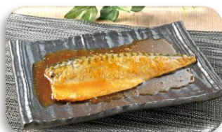
レンジで簡単 骨取りさばみぞれ煮