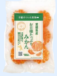
お日様たっぷりみかん

『手紙のついた野菜と果物』が冷凍食品として登場！生産者こだわりの商品がいつでも気軽にお楽しみいただけます。