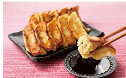
国産豚肉・野菜使用！ 薄皮仕立ての肉餃子