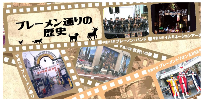
モトスミ・ブレイメン通り商店街の歴史や取り組み、地域情報を発信