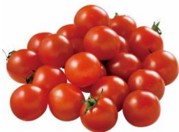
「手紙のついた野菜」 甘さがギュッと赤美味ミニトマト