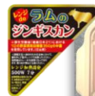
レンジdeラムのジンギスカン