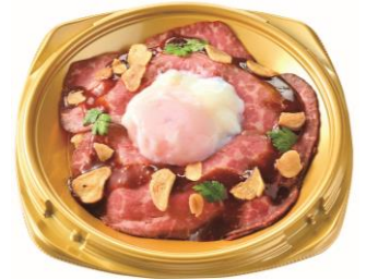
ローストビーフ丼 (ガーリックライス)