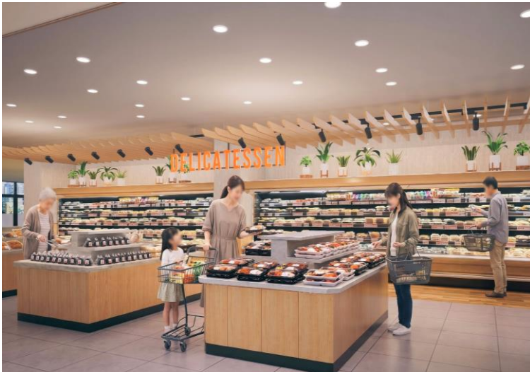
※デリカ売場イメージ