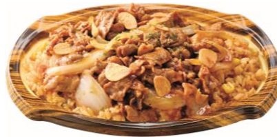
鉄板炒め！ビーフガーリックライス