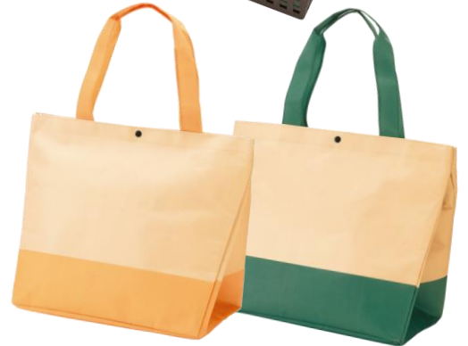
※内容は変更となる場合がございます