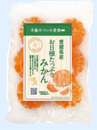
お日様たっぷりみかん

商品のQRコードからアクセスすると生産者からのお手紙が読み、「いいね！」ボタンを押したりお返事を書いたりできます。商品が届くまでの物語、ちょっと覗いてみませんか？