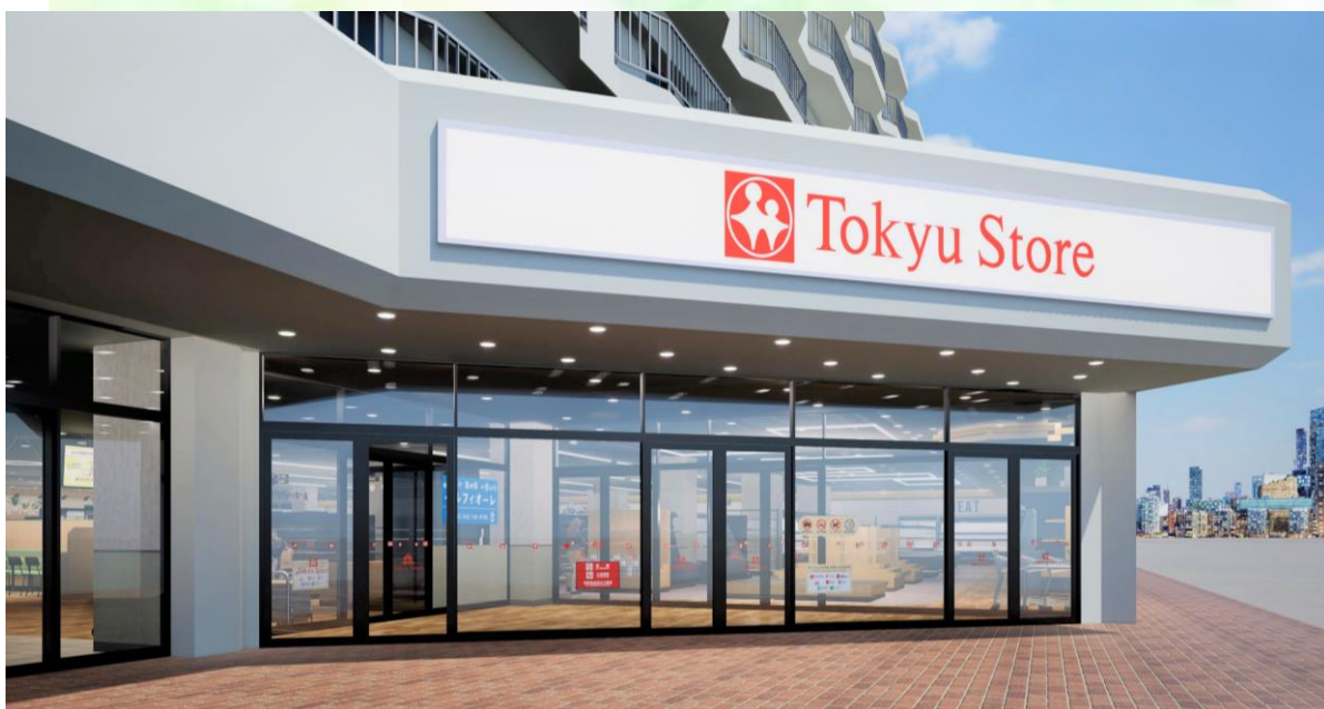
※店舗外観イメージ

『東急ストア 東林間店』は、2026年6月11日（木）にリフレッシュオープンいたします。東林間エリアは40～50代のミドル世代が多く、単身・2人世帯が半数以上を占める地域です。当店ではお客さまのライフスタイルに合わせ、産地直送の新鮮な野菜や人気の銘柄肉を取り揃え、素材から調理を楽しみたい方にもご満足いただける品揃えを実現します。鮮魚売場では、調理方法やメニュー提案のご要望にもお応えします。ほかにも、できたてのお惣菜や温めるだけの生鮮簡便品、冷凍食品などを中心に、すぐに召し上がれる商品を豊富に取り揃えます。店内製造のお惣菜は、当社オリジナル商品『RICHDELI(リッチデリ)』をはじめ、専用窯で焼きあげるピザや中華総菜、手づくりおにぎりなどがおすすめです。デリカ売場に設置されるライブサイネージでは、店内厨房でお惣菜を製造する様子をご覧ください。